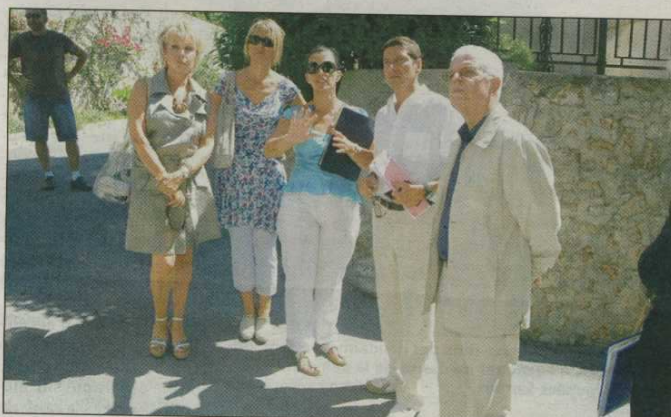
Visite technique des élus et responsables des affaires funéraires au cimetière du Grand Jas avant de passer à la réalisation d'un projet qui vise à faire de ce cimetière historique un élément touristique à part entière.

De quoi baliser un parcours de visite autour d'environ 300 sépultures remarquables. « Le Grand Jas est un lieu historique et nous allons en faire le Père Lachaise de la Côte d'Azur » enthousiasmait ré-